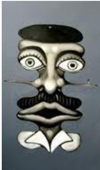
Totem, V. Corpet