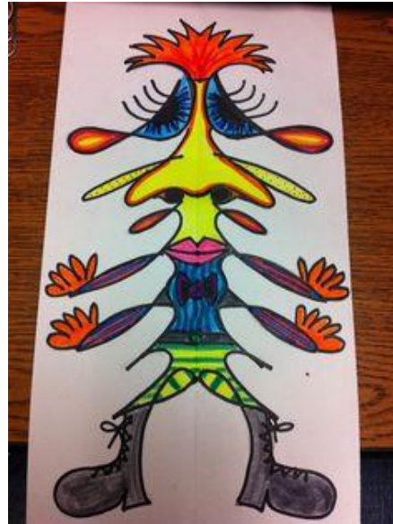
Un exemple avec le prénom Shelly

Vous trouverez de nombreux exemples de réalisations dans la fiche tuto ci-dessous :