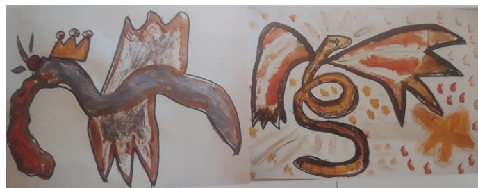
Photo prise dans Arts visuels Contes et Légendes éditions ScérEn CRDP Franche Comté 2009 p 43

Citations recueillies par Edith Montelle dans L'Oeil de la Vouivre, Récits mythologiques , La Nuée Bleue, 1998 P 16-17 1998 (réédition chez Slatkine en 2006)