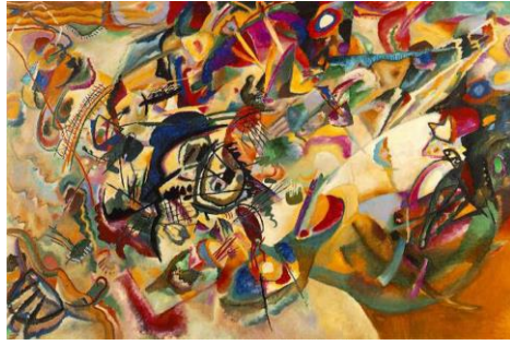
Kandinsky Composition VII 1913